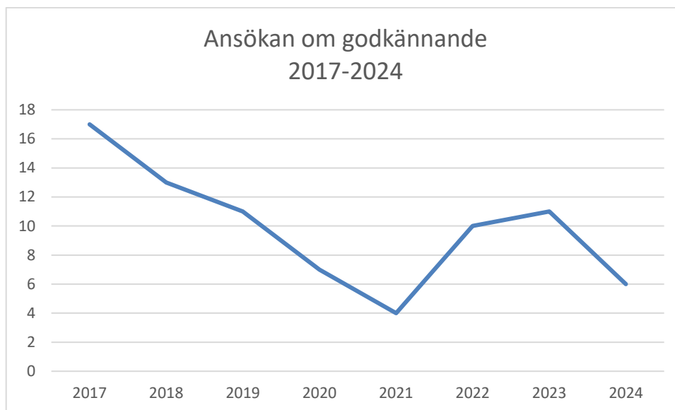
Bild 4. Antal ärenden om godkännande mellan 2017-2024. Ärendena innefattar exv även utökning av antal platser, ansökan om undantag från öppenhetsprincipen m.m.