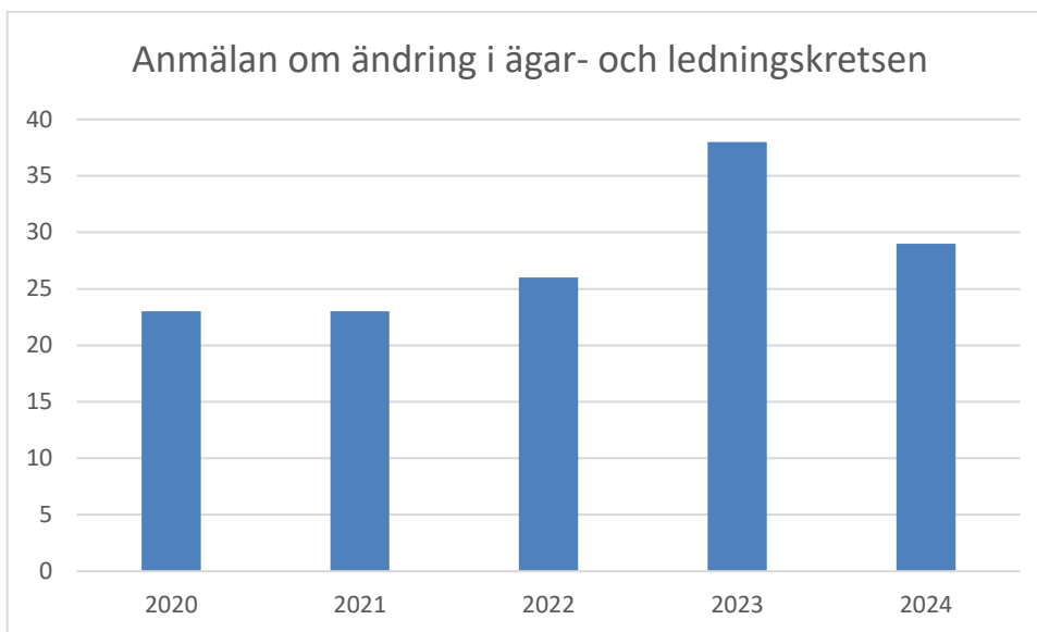
Bild 5. Tabellen visar antal ärenden som avser anmälan om ändring i ägar- och ledningskretsen under åren 2020 – 2024